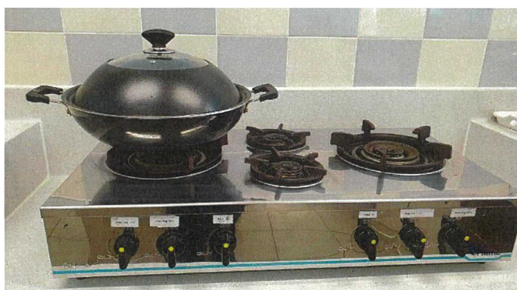
4 頭氣體煮食爐 (兩隊參賽組共用)