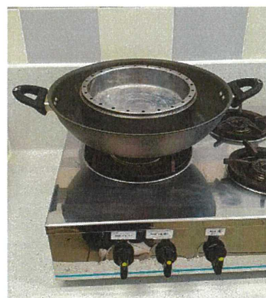
中式大鑊 (可放蒸盆)