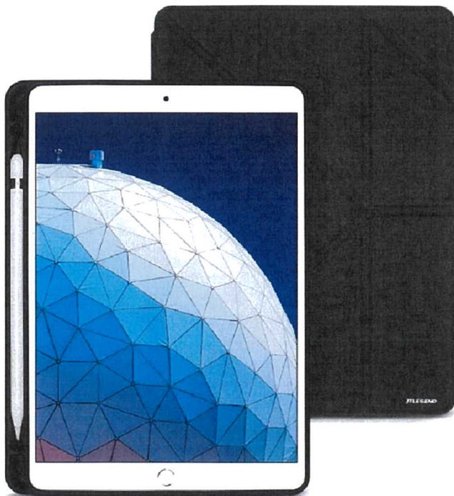
平板電腦連保護套